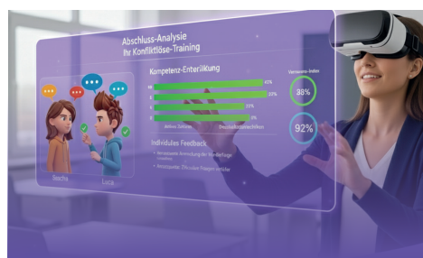
Das individuelle Feedback zeigt, wie sich Ihre Fähigkeiten entwickeln und ausgebaut werden können.

Wir setzen auf spielerisches Lernen, um neue Fähigkeiten wirklich zu verinnerlichen. Deshalb sind die Trainingseinheiten so gestaltet, dass sie Lust machen eine weitere Runde zu trainieren: keine Runde ist wie die andere.