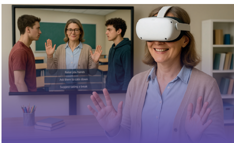
Durch interaktive Gespräche mit virtuellen Charakteren lernen Sie Konflikte zu deeskalieren.

Quelle: Bedarfsanalyse Konfliktsimulator (2025).