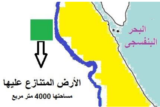
خريطة لمدينة الوسعاية