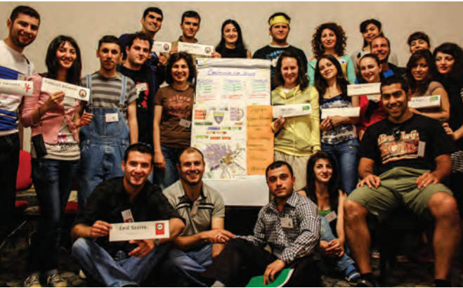
Am Ende konnten sich die Teilnehmenden auf drei Bauvorhaben einigen