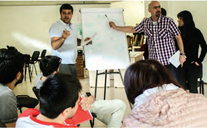
Verschiedene Anlagemöglichkeiten werden vorgestellt und diskutiert