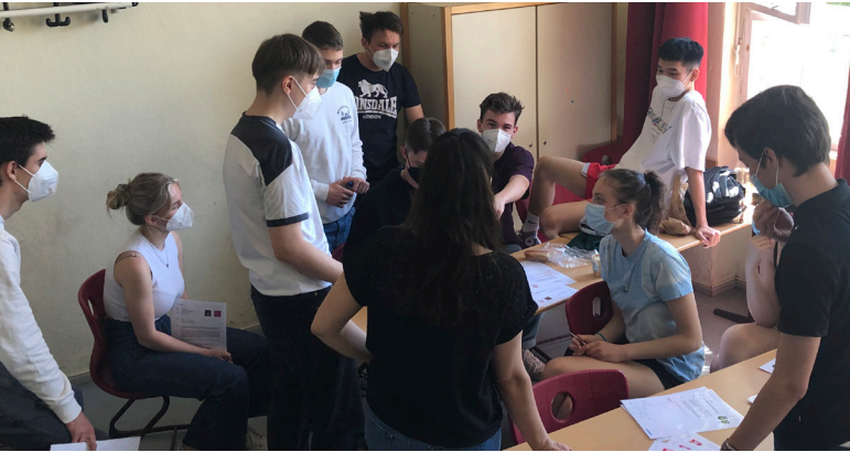
Informelle Verhandlungen kurz bevor die Koalitionsverhandlungen beginnen.